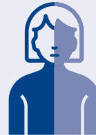
تنميل أو شلل مفاجئ في الوجه أو الذراع أو الساق