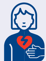
درد قیسه سینه یا سپت شدن قیسه سینه