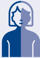
Intorpidimento improvviso o paralisi del viso, del braccio o della gamba