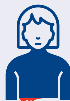
Kutokwa na damu nyingi