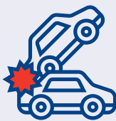
Tai nạn nghiêm trọng