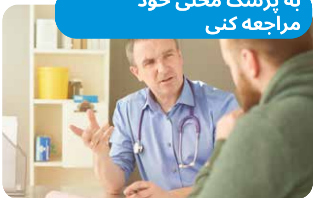
پزشک خانه ملی 13SICK