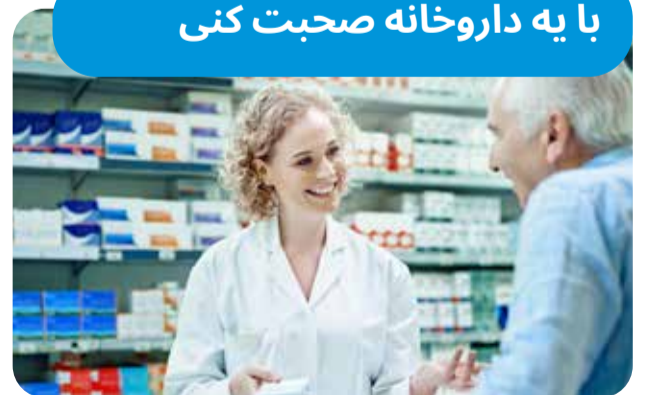
داروخانه های شبانه روزی ویکتوریا