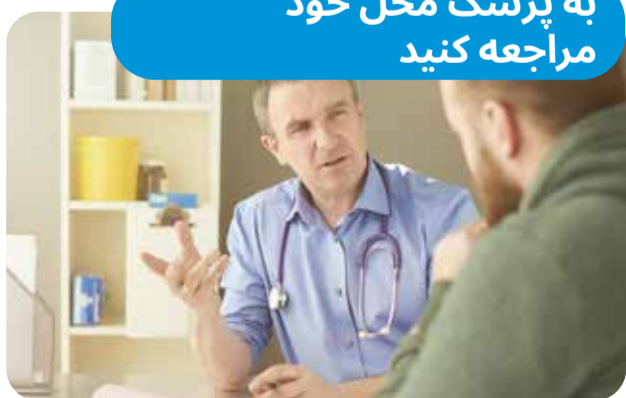
13SICK سرویس ملی پزشکان خانگی