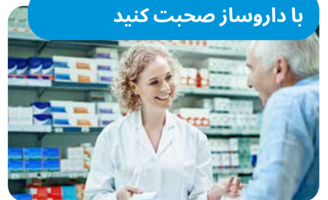
Supercare Pharmacies Victoria

عضو آمبولانس ویکتوریا شوید. عضویت سریع و آسان است! به این نشانی رجوع کنید