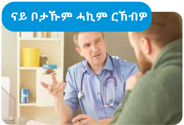
ናይ ቦታኹም ሓኪም ርኽብዎ 13SICK ሃገራዊ ናይ ገዛ ሓኪም

ኣባል ናይ ኣምቡላንስ ቪክተርያ ኩኑ። እዚ ህጹጽን ቀሊልን'ዩ ንምእታው