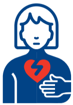
ቃንዛ ኣፍልቢ ወይ ምትራር ኣፍልቢ

ቀጥታ: ኣምቡላንስ ዘድልዮ ህጹጽ ንሂወት ዘስግእ ኢመርጅንሲ ነዚ ዝስዕብ ዮጠቓልል