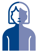
ሃንደበታዊ ድንዛዘ ወይ ምልማስ ናይ ገጽ፡ ኢድ ወይ እግሪ