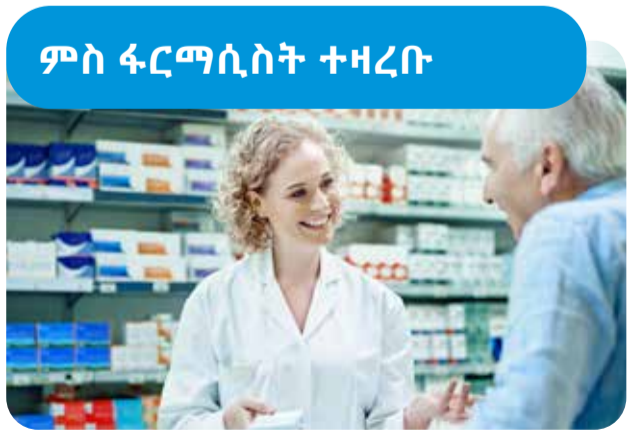
ፎርማሲታት ሱፐርኬር ቪክቶሪያ