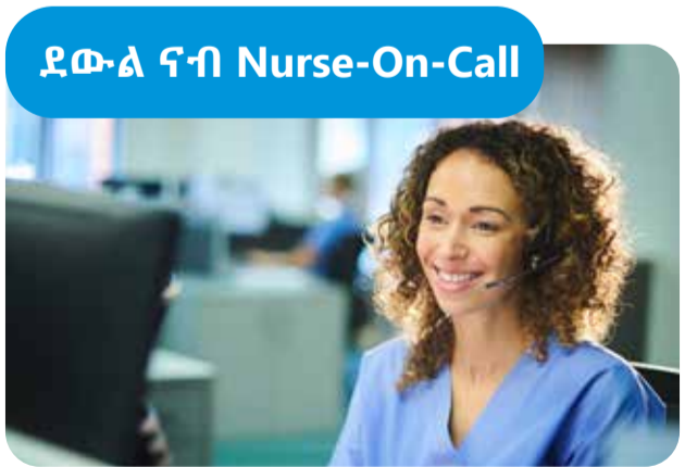
ደውል ናብ Nurse-On-Call 1300 60 60 24